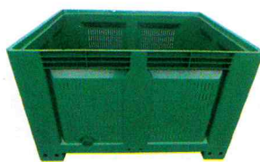
Big Box Alto