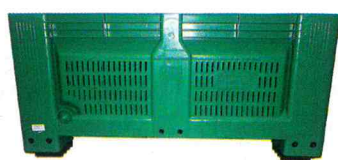
Big Box Bajo

Alquiler y Gestión Integral de su parque de Envases